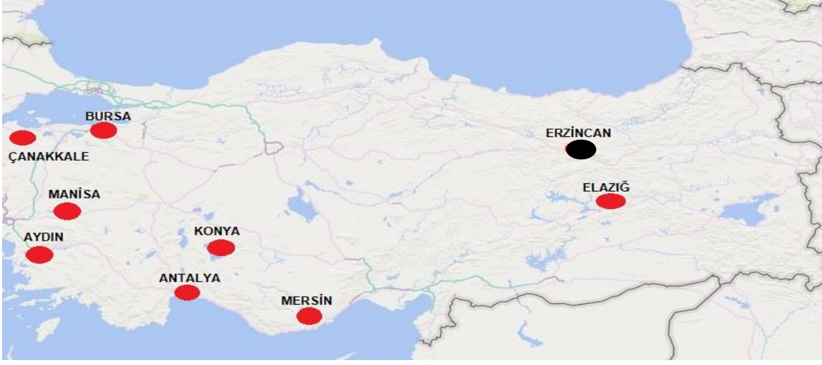
Şekil 1. 2021 yılı çilek rekoltesi (580 BİN TON)